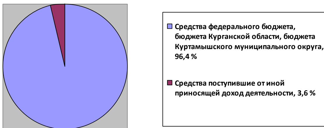
Рисунок 3 – Удельный вес источников финансирования дополнительных образовательных программ, в %

Структура источников финансирования учреждений дополнительного образования изображена на рисунке 3.