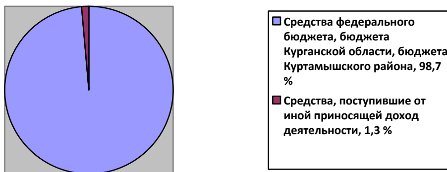
Рисунок 3 – Удельный вес источников финансирования дополнительных образовательных программ, в %

Приносящей доход деятельностью занимается одно учреждение дополнительного образования (ДШИ). Структура источников финансирования учреждений дополнительного образования изображена на рисунке 3.